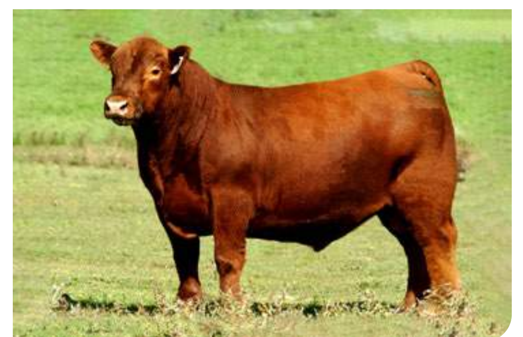
Angurria , su padre.