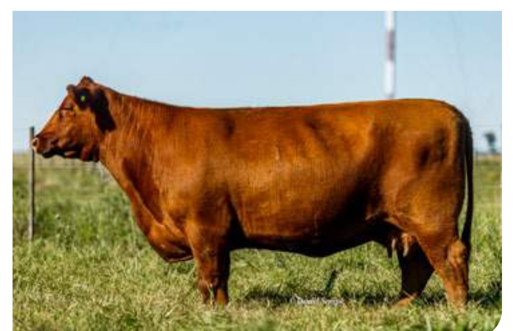
RP 4913 Upa , su madre.